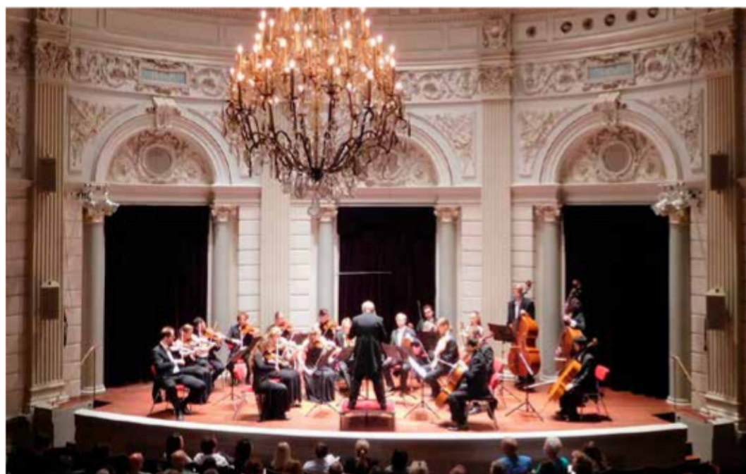
Het Ciconia Consort in de kleine zaal van het Concertgebouw.

'Rheingold', cd van het Ciconia Consort. Prijs: € 13,84. Te bestellen via info@ciconiaconsort.nl .